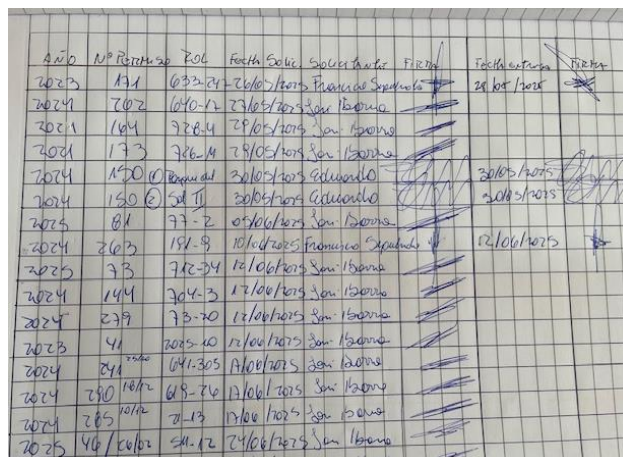
Imagen referencial registro Desarchivo Dpto, Edificación.