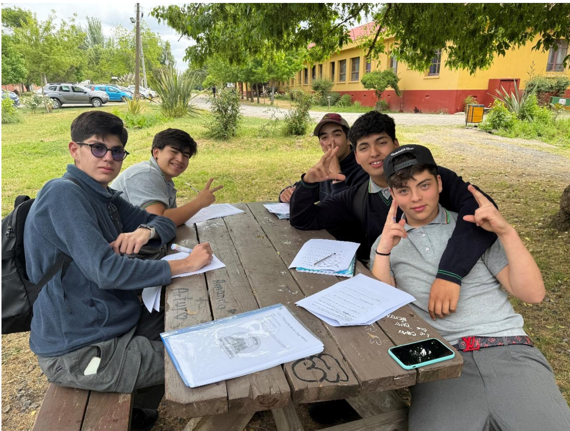
Clase dirigida con enfoque en la evaluación cualitativa del aprendizaje, perteneciente al Programa “Turismo en tu Colegio” de la Oficina Municipal de Turismo, desarrollada para la Escuela Agrícola de Molina.