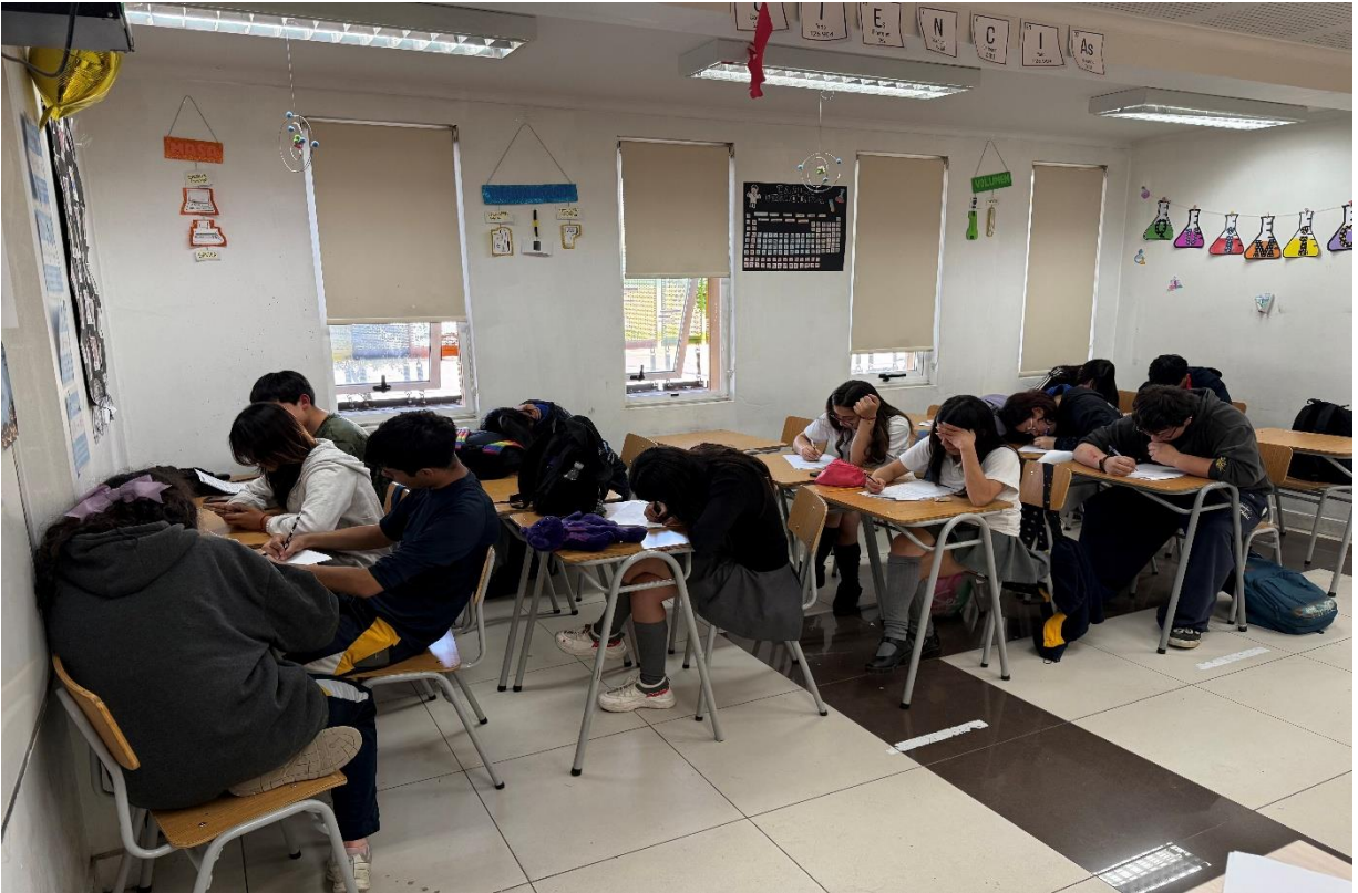
Clase dirigida con enfoque en la evaluación cualitativa del aprendizaje, perteneciente al Programa “Turismo en tu Colegio” de la Oficina Municipal de Turismo, desarrollada para el liceo bicentenario de molina.