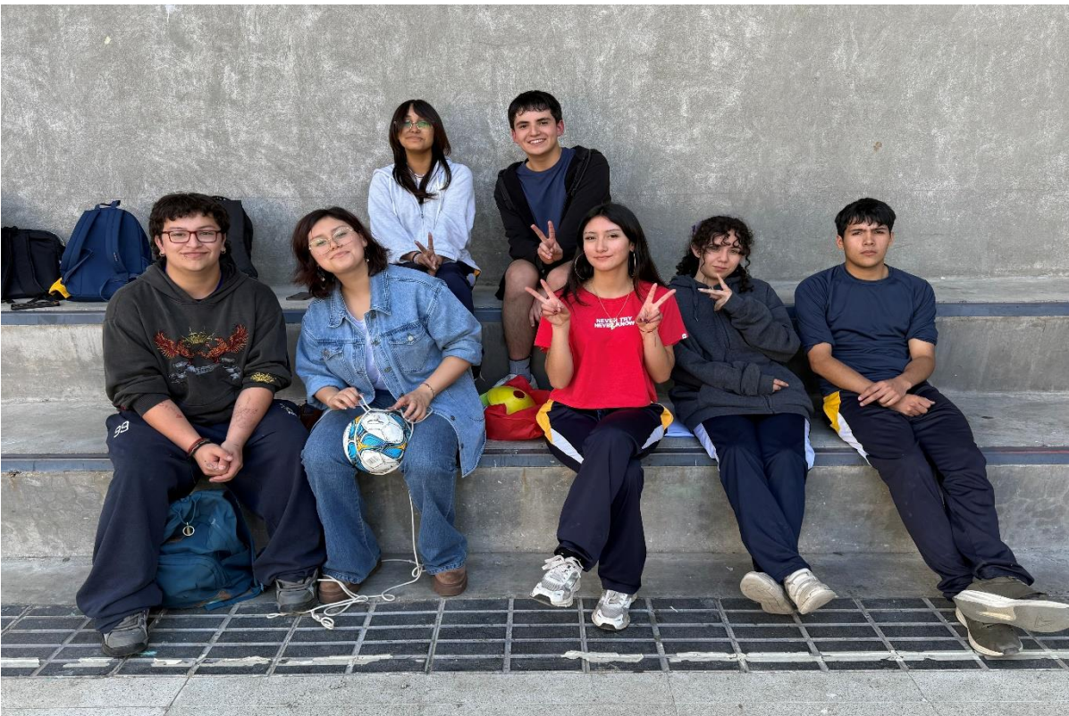
Actividad lúdica orientada a fortalecer la reacción, la toma de decisiones y la motricidad fina, en el marco del Programa de la Oficina Municipal de Turismo, desarrollada para el Liceo Bicentenario de Molina.