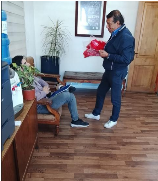
Entrega de información y derivación de gestión en alcaldía